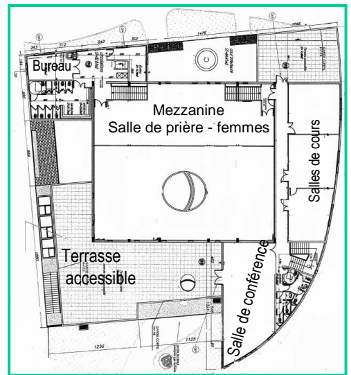
1 er niveau