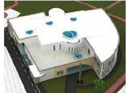
Maquette de la mosquée

Géographiquement l'édifice projeté sera situé dans la zone Nord du parc urbain à proximité de la nouvelle piscine et du centre commercial Carrefour. De par sa situation, la future mosquée profitera ainsi des nombreux espaces publics environnants dont une offre importante en matière de stationnement . L'édifice aura une surface au sol de 1575m 2 et une surface hors œuvres nette constructible de 2654m 2 . Il s'étendra sur trois niveaux et comportera une salle de prière principale pour hommes, une pour femmes et des salles annexes d'une capacité d'accueil totale de +2.000 fidèles , mais aussi cinq salles de cours (chacune 40m 2 ), une bibliothèque et une salle de conférence , autorisant en plus du culte, des activités et manifestations culturelles et festives. Un symbole du minaret sera dressé, détaché du bâtiment, devant l'entrée principale (voir tableau récapitulatif)